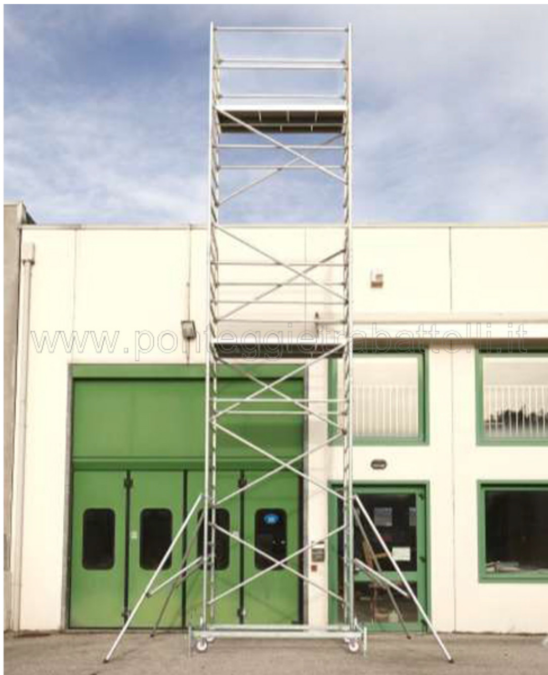
PONTEGGIO MONTATO CON CAMPATE SUCCESSIVE